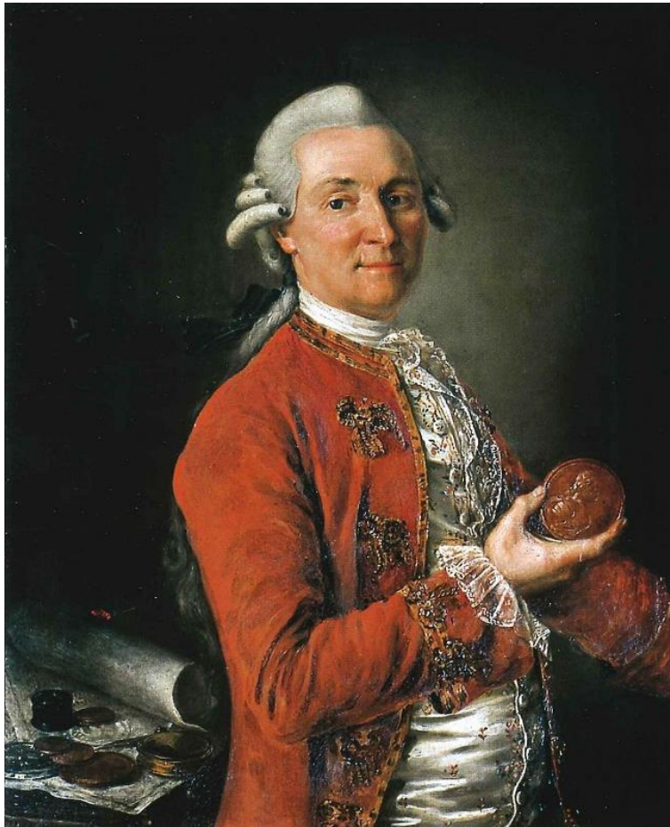
Georg Thomas von Asch (1729-1807) Gemälde von Kyrill Golowatschewski, Öl auf Leinwand, 86 x 70 cm, Schenkung von 1780